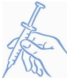
Obrázek 7: Připraveno k aplikaci