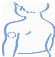
Horní část paže