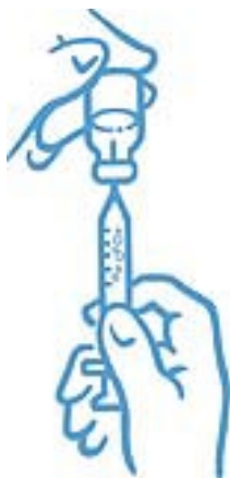
Obrázek 6: Odstraňte bubliny a doplňte správnou dávku