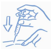
Obrázek A: Zlehka stiskněte kůži a aplikujte podle návodu