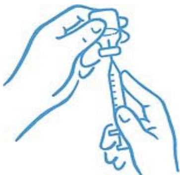
Obrázek 4: Hrot v tekutině