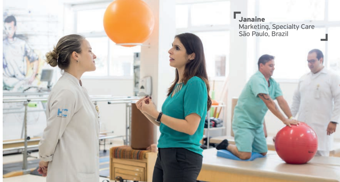
Janaine Marketing, Specialty Care São Paulo, Brazil

possiamo fare riferimento alla "Policy globale sulle interazioni con le organizzazioni di pazienti e i singoli pazienti" di Ipsen o contattare l'Ufficio Affari Pazienti Globali.