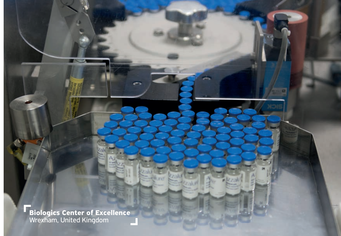
Biologics Center of Excellence Wrexham, United Kingdom

possiamo contattare l'ufficio Market Access. In caso di dubbi, parliamo con il nostro responsabile o con il Business Ethics Team oppure possiamo utilizzare l'apposita piattaforma di segnalazione Whispli ( https://app.whispli.com/IpsenAlerts ) o l'indirizzo email Ipsen.Ethics.Hotline@ipsen.com .