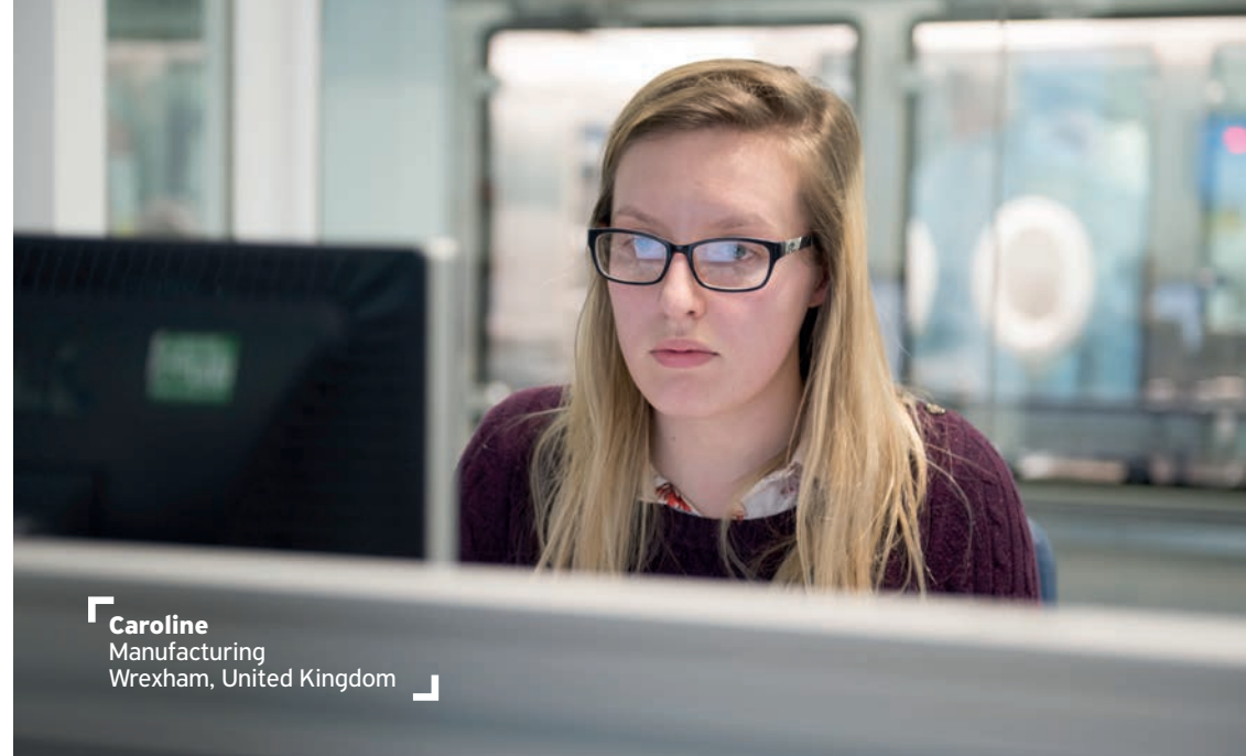
Caroline Manufacturing Wrexham, United Kingdom