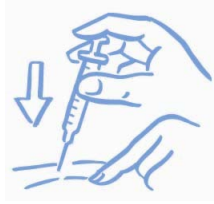
Abbildung A: Haut leicht zusammendrücken und gemäß Anweisung injizieren