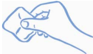
Abbildung B: Mull oder Watte sanft auf die Injektionsstelle pressen (nicht reiben)