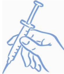
Abbildung 7: Bereit für die Injektion