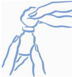
Abbildung 1: Oberseite mit Alkohol abwischen