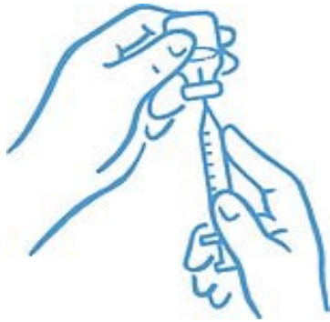
Abbildung 4: Spitze in der Flüssigkeit