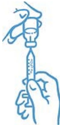
Abbildung 6: Luftblasen entfernen und Spritze erneut füllen