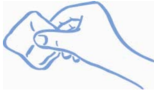
Abbildung B: Mull oder Watte sanft auf die Injektionsstelle pressen (nicht reiben)