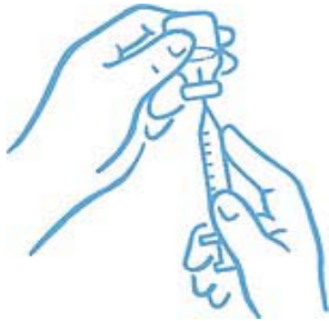
Abbildung 4: Spitze in der Flüssigkeit