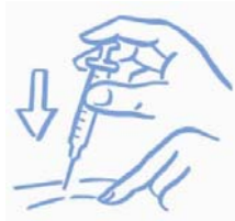
Abbildung A: Haut leicht zusammendrücken und gemäß Anweisung injizieren